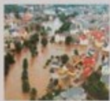
Döbeln, August 2002