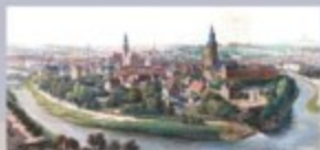
Stadtplan Döbeln 1910

Ab in die Mitte! Die CityOffensive Döbeln