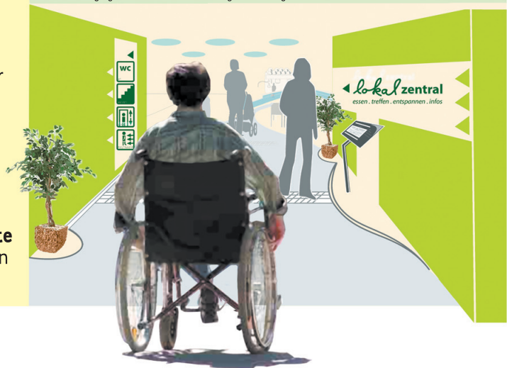
Einladender Eingang mit Bodenstruktur und bedarfsgerechter Navigation

Das integrative Begegnungszentrum lokal zentral wird in der Mitte der Chemnitzer Innenstadt im Erdgeschoss eines derzeit im Bau befindlichen multifunktionalen Geschäfts- und Bürohauses in verkehrsgünstiger Lage angesiedelt. Der Gebäudekomplex gilt als Modellbeispiel für barrierefreies Bauen. Seine Fertigstellung ist Ende 2010 geplant.