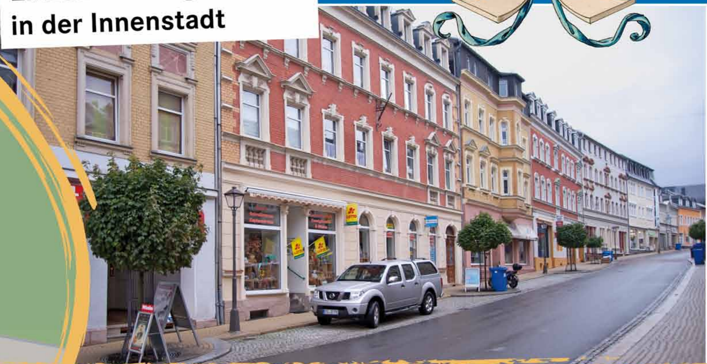
Einzelhandelsgeschäfte in der Innenstadt