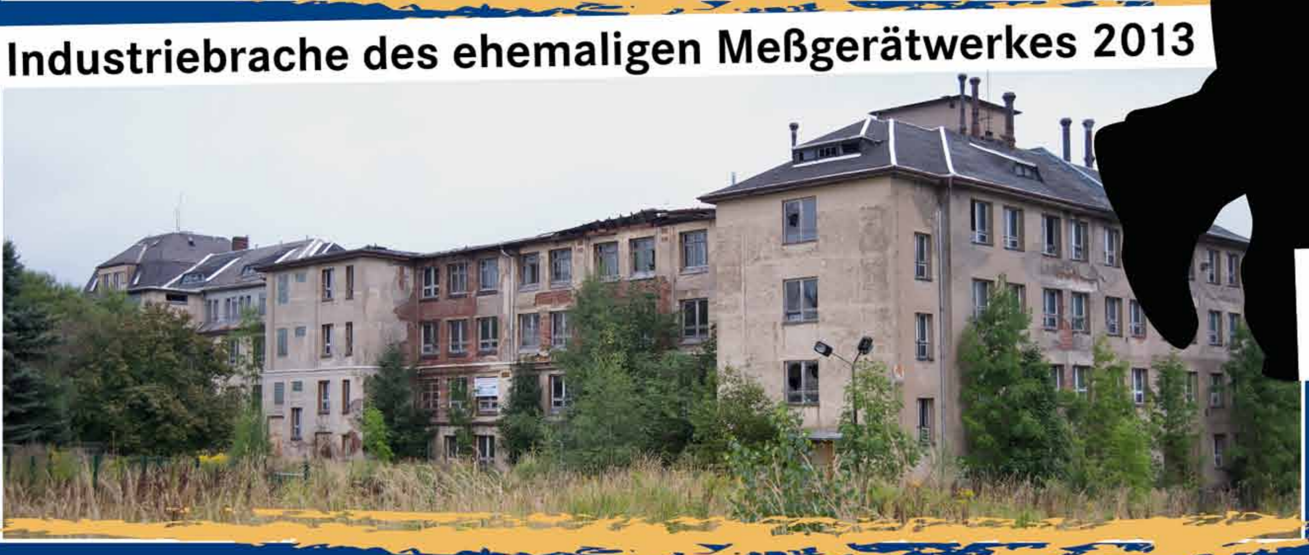
Industriebrache des ehemaligen Meßgerätwerkes 2013