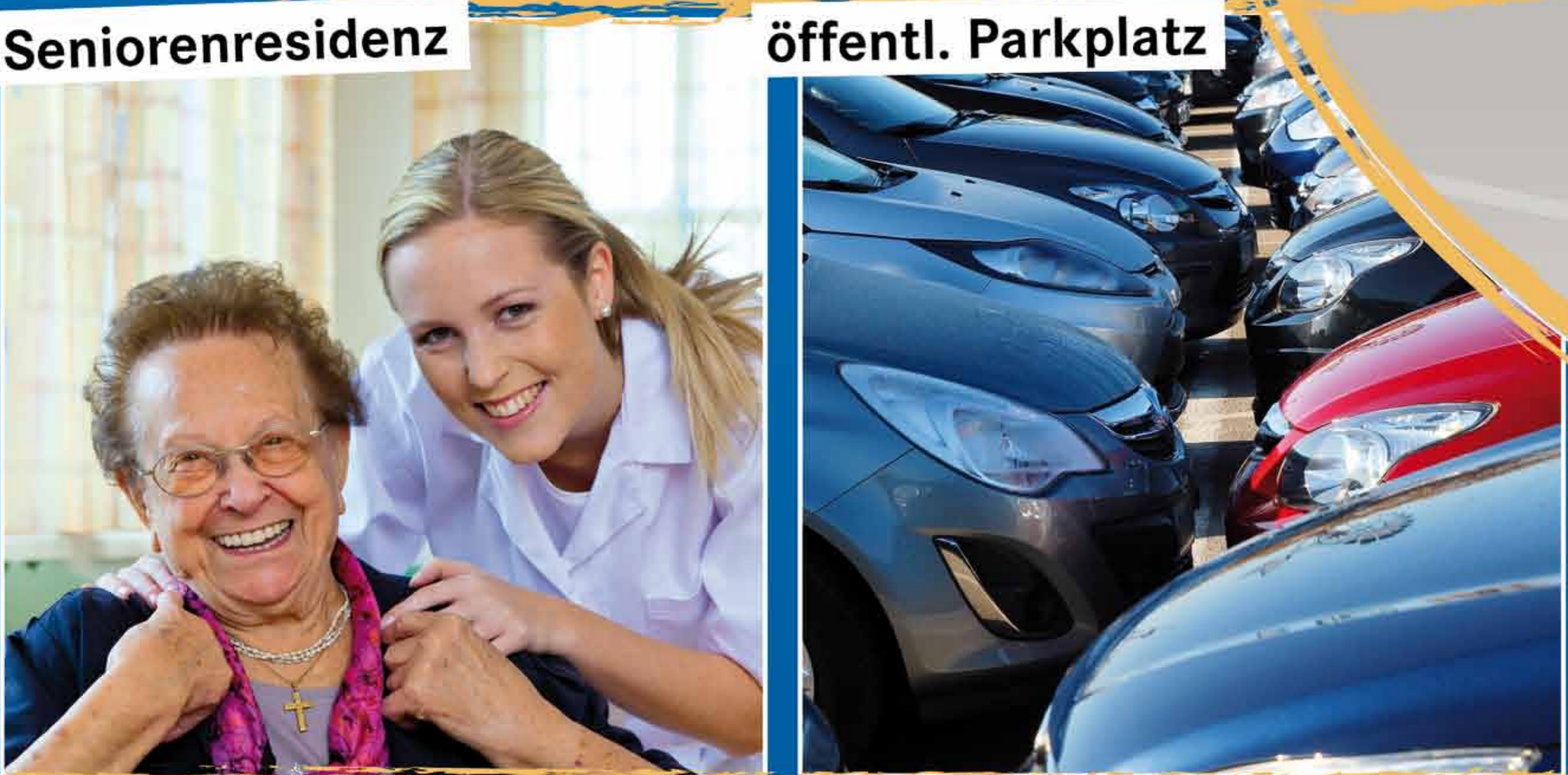
Seniorenresidenz öffentl. Parkplatz